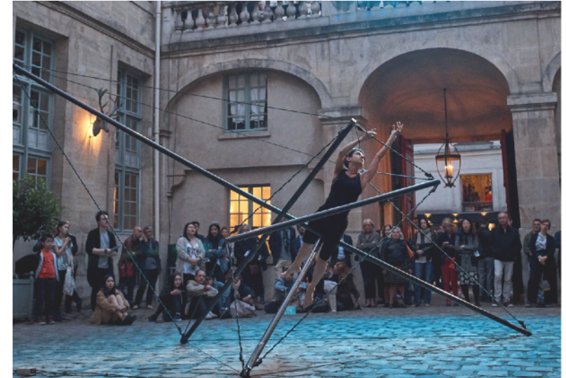
Strata.2 au Musée de la Chasse et de la Nature