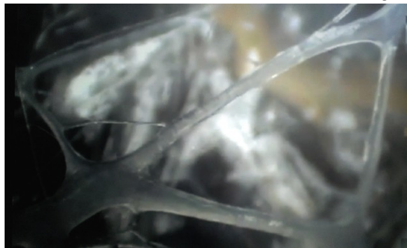
Tissu connectif ou fascia - Promenade sous la peau - vidéo

Kenneth Snelson, à qui va le mérite d'avoir en premier expérimenté ces structures, préfère parler de « floating compression » ou «un flot de compression dans un océan de tensions». Une structure en tenségrité est un système dans la mesure où le comportement de l'ensemble n'est pas réductible aux comportements de ses seuls éléments. C'est le propre en fait de toute structure non hiérarchisée. Toutes les forces sont soumises à tous les éléments structuraux, ce qui fait que la moindre tension accrue à un des éléments est transmise à tous les éléments même éloignés.